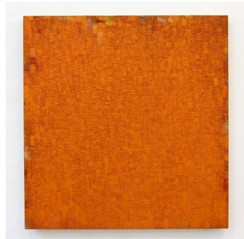
#05 - Orange Orange Rot Orange, 2012 Ölfarbe auf Leinen, auf Holz, 73 x 69.5 cm

Seine bestimmenden Themen sind die Malerei, die Farben und die Wahrnehmung dieser. Der Maler, der Farbpigmente in Verbindung mit Öl und Ei eigens mischt, bevor er sie in Schichten auf die Träger aus Holz oder Leinwand mit einem Pinsel setzt, nimmt Einfluss auf die Materialität der Farbe, auf ihre Konsistenz und so gelingt es ihm, hohe Variationen zu kreieren, die sich vor allem im Wechsel des Lichts und im Wandel des Blickwinkels auf besondere Weise dem Betrachtenden offenbaren.